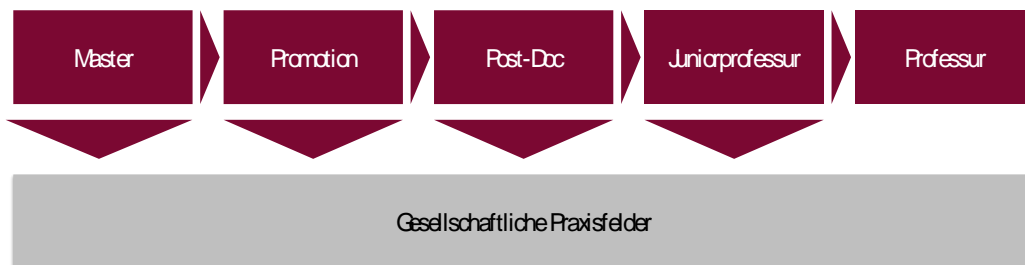
Abbildung: Qualifikationsstufen für den wissenschaftlichen Nachwuchs an der Leuphana

Ziel der Leuphana ist es, eigenständige Forschungsaktivitäten des wissenschaftlichen Nachwuchses in jeder Qualifikationsphase (s. Abbildung) zu ermöglichen und durch Beratungsangebote und unterschiedliche Unterstützungsformate zu fördern. Die Leuphana wird die Empfehlungen der Wissenschaftlichen Kommission Niedersachsen und des Wissenschaftsrats, die in Absprache mit der dienstvorgewetzten Professur für Postdoktoranden_innen die eigenständige Einwerbung und Leitung von Drittmittelprojekten vorsehen, in geeigneter Weise umsetzen. Dies bezieht sich nicht nur auf ausdrückliche Nachwuchsformate (z.B. DFG „eigene Stelle“), sondern auch auf offene Ausschreibungen, die die Gruppe der möglichen Antragssteller nicht ausdrücklich einschränken.