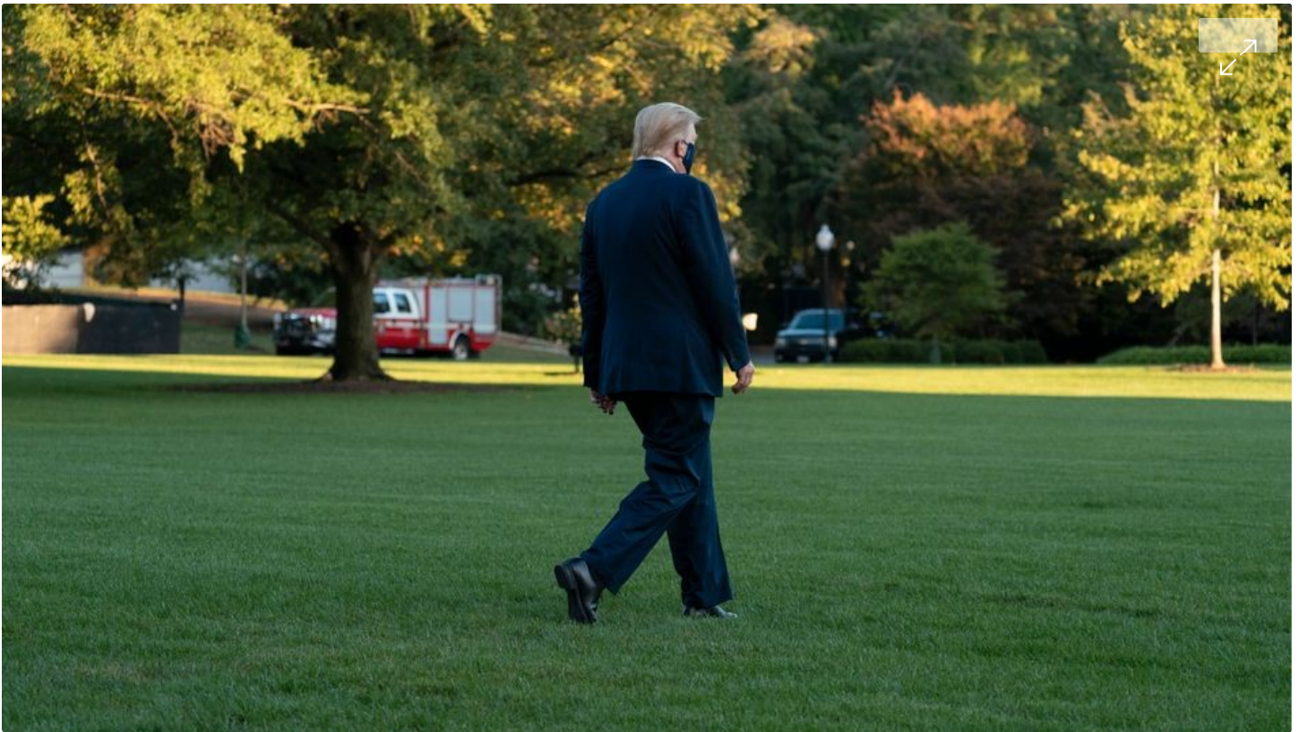
Donald Trump auf dem Weg zum Helikopter, der ihn ins Krankenhaus bringt