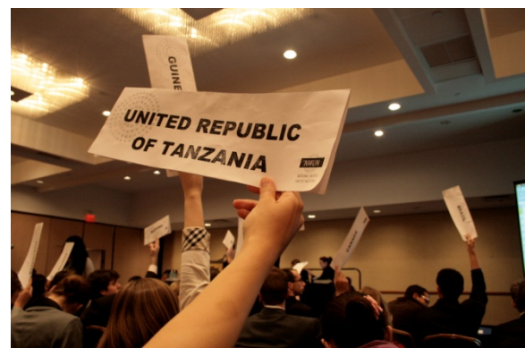
Mit dem Placard meldet an sich zu Anträgen und Abstimmungen.

Aufwändig führte er zu allererst der Roll Call durch, bei dem jedes Land aufgerufen wird, um zu bestätigen, dass die Delegierten anwesend und zur Wahl verpflichtet sind. Dann wurde das Parkett für Anträge eröffnet, woraufhin sich der erste Delegierte zu Wort meldete und alle Versammelten aufforderte, sich zu einer Schweigeminute in Andenken an die unschuldigen Opfer der Rwanda-Konflikte zu erheben. Ein nächster Antrag forderte die Öffnung der Sprecherliste. Da der Chair diesem statt gab, kam nun die Frage, auf die wir schon gespannt gewartet hatten. Er fragte, wer auf der Liste aufgenommen werden wolle und in Sekundenschnelle schoß unser Länderschild waagrecht in die Höhe, zeitgleich mit denen aller anderen Nationen. Vorgewarnt durch unsere Tutoren hatten wir sorgsam darauf geachtet, zeitig im Saal zu sein und unsere Sitze so zu wählen, dass wir im Blickfeld des Chair saßen und nicht in den letzten Reihen rumlungern mussten, wo die Schilder rein physikalisch nicht mehr lesbar sind. Und tatsächlich, das Glück war uns hold, der Chair nannte irgendwann auch den Namen unserer Republik, woraufhin uns der Reporter auf die 51te Stelle der projizierten Wordtabelle aufnahm.