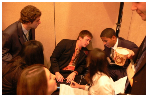
Im Sitzen, Stehen oder Knien wird in der Informellen Debatte verhandelt.