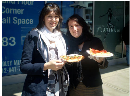
Bei amerikanischen Kulinarikarten geht das Verhandeln weiter.

Die Arbeitsstunden bis zur abschließenden Wahl waren voller formaler Tücken und hitzigen Diskussionen, doch schlussendlich wurde unsere Draftresolution in einem vierstündigen Prozess mehrheitlich und ohne zusätzliche Änderungen angenommen. Das hat leider nicht so viel Bedeutung. Die unkritischen Massen winkten unrealistischer Weise alle 14 Draftresolutionen zum gleichen Thema durch. Manchmal ist NMUN auch nicht mehr als eine einfache, aber spannende Simulation.