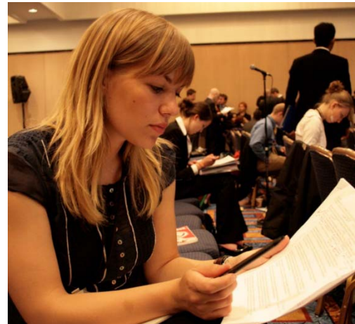
Die Delegierte nutzt die Zeit vor Beginn der Sitzung zur Wiederholung der zurechtgelegten Argumente.