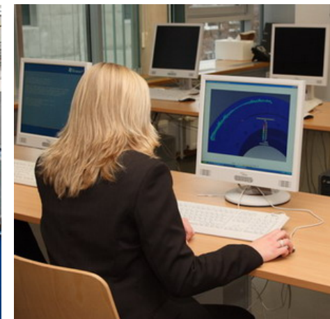
Neubau Volgershall, Campus für die Ingenieur- und Wirtschaftsingenieurausbildung