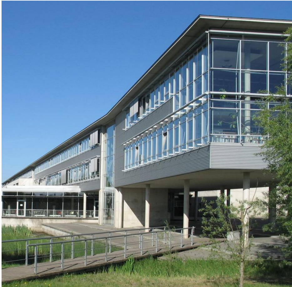
Technologie Campus Volgershall