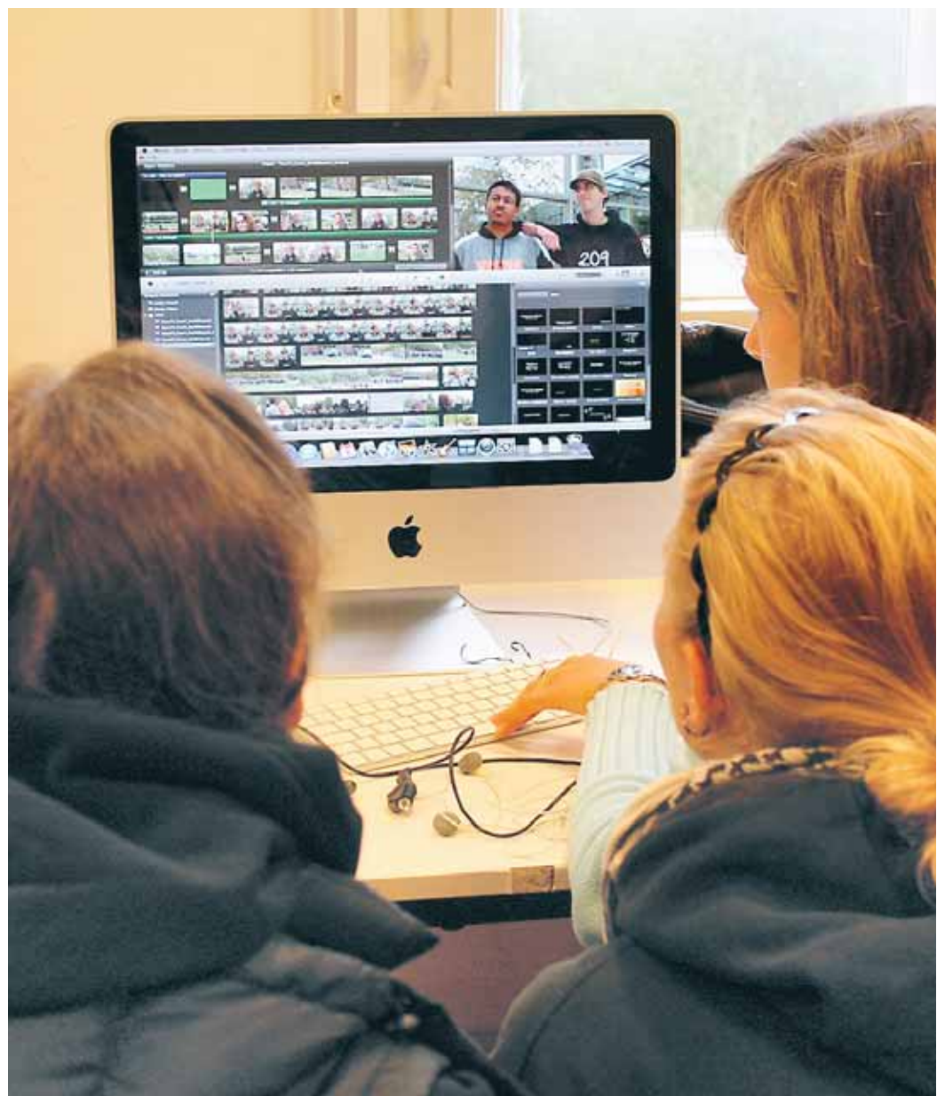
Schnipp, schnapp: Den vorletzten Tag der Startwoche verbrachten viele Erstsemester komplett am Computer.