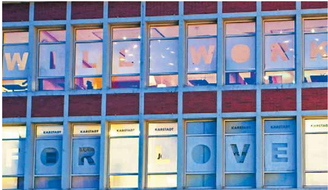
Provokation an der Karstadt-Fassade: Spielt der Slogan auf die Karstadt-Insolvenz an?