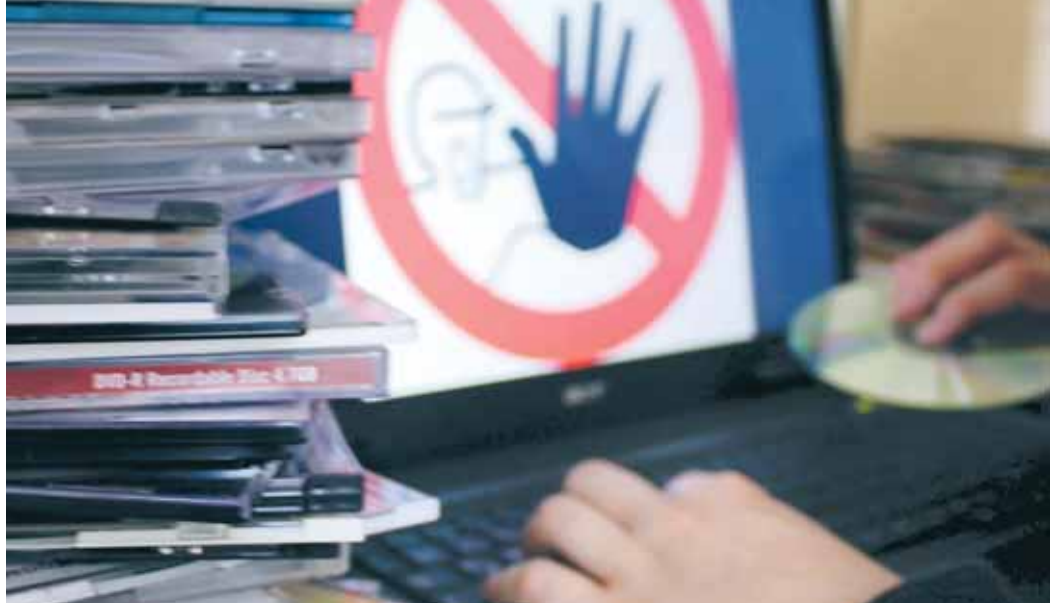
Praktisch, aber illegal: Beim Herunterladen von Filmen fehlt vielen Nutzern das Unrechtsbewusstsein.