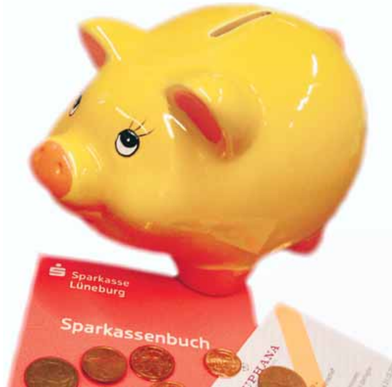
Spielt eine tragende Rolle in vielen Studentenleben: das Sparschwein.

Auch Linda hat sich im ersten Semester durch Nebenjobs über Wasser gehalten. „Mein Job war so zeitaufwendig, dass ich die Uni meinem Arbeitsplan angepasst habe. Ich habe mein Studium vernachlässigt und mich selbst zu sehr unter Druck gesetzt. Irgendwann wurde mir alles zu viel. Da ich leider kein BAföG erhalte, blieb