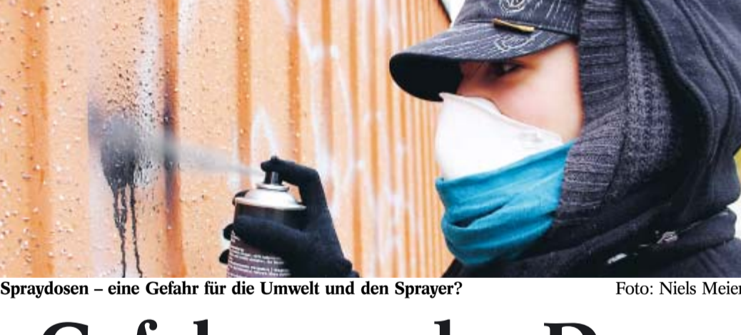
Spraydosen – eine Gefahr für die Umwelt und den Sprayer?