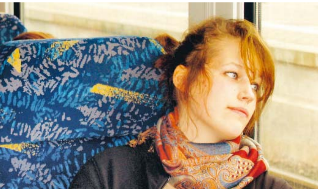
„Wie schön wäre es, schon zu Hause zu sein“, denkt sich diese Studentin.