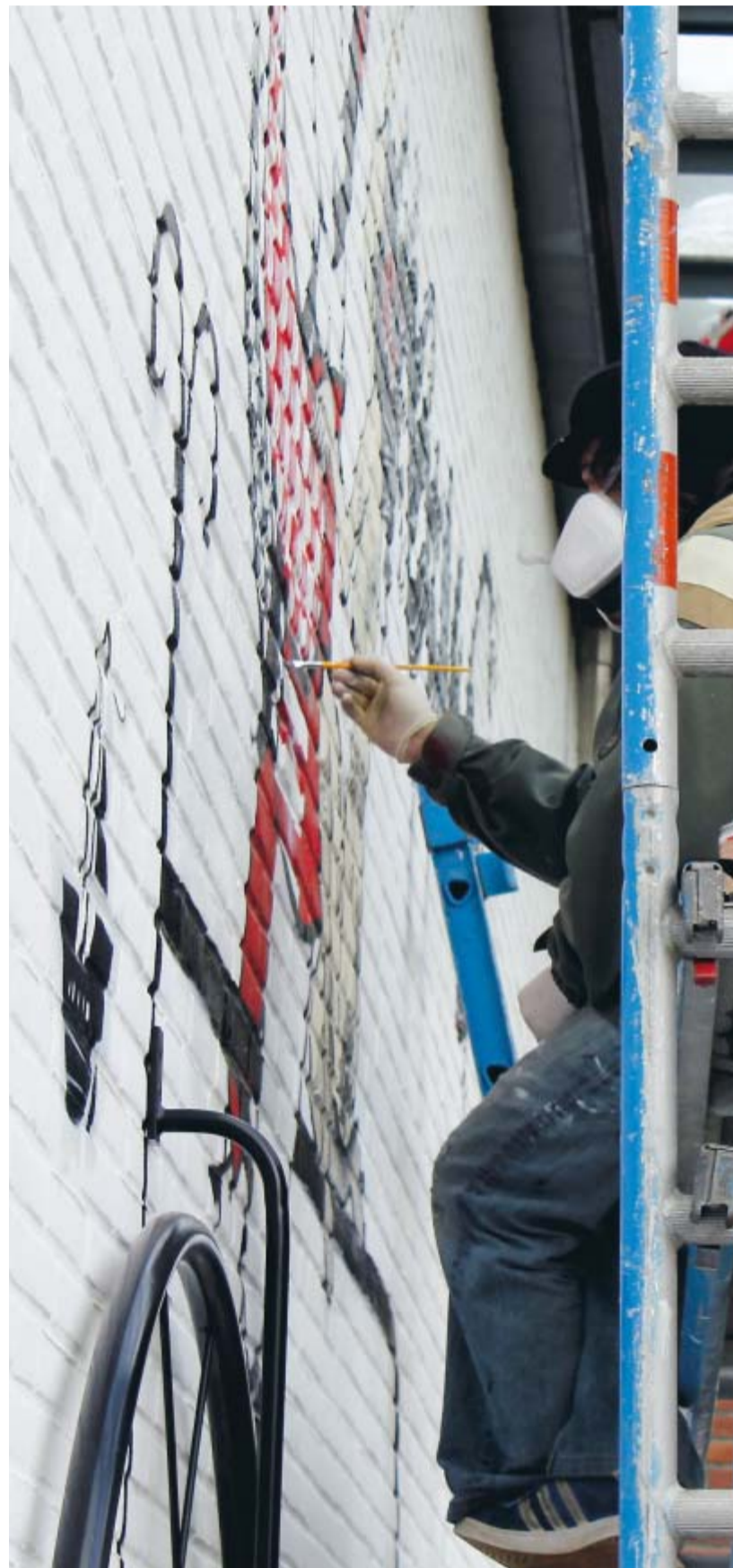
Vergangene Woche war die Wand des Hörsaals 1 auf dem Campus noch eintönig weiß. Die beiden brasilianischen Künstler Vitché und Jana haben sich aufgemacht, das zu ändern: Sie sind zwei von 30 Künstlern des Leuphana Startwochen-Projektes ARTotale, die heute beginnt: Stehend oder sitzend auf einem Baugerüst verzieren sie die große Fläche. Eine Mischung aus Graffiti und Installation ist entstanden: Ein an der Wand montierter Fahrradreifen verschmilzt mit dem Rahmen des Fahrrads, der allerdings aufgesprüht ist, zu einem vollkommenen Ganzen. Farbenprächtige Gewänder bekommt der fahradfahrende Mann, die Dame erhält ein filigranes Henna-Tattoo.