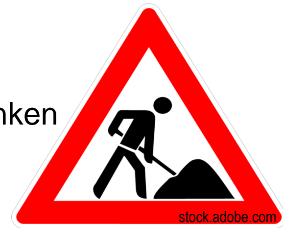
Hoher wahrgenommener Aufwand