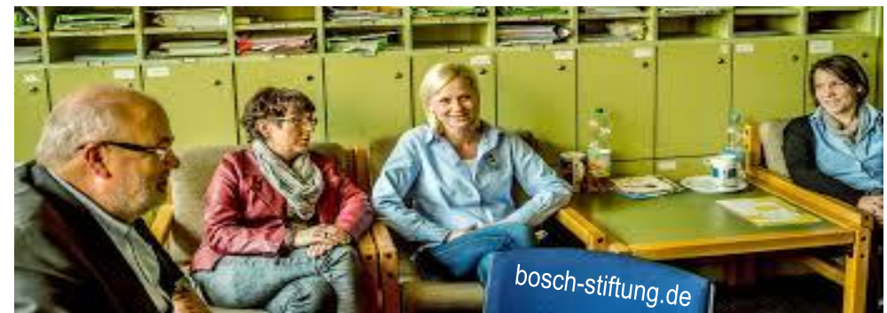
Erschwerte Kommunikation im Kollegium