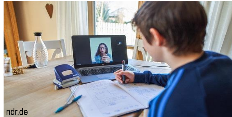
Schlechtere Kommunikation mit den SuS