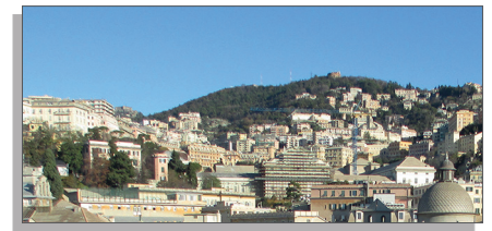
UNIVERSITÀ DEGLI STUDI DI GENOVA » www.unige.it

Das deutsch-italienische Studienprogramm stellt eine auf interkulturelle Kommunikation ausgelegte Spezialisierung im Rahmen der Kulturwissenschaften dar. Ein besonderer Mehrwert ergibt sich für Kulturwissenschaftler_innen im Sinne der drei Grundprinzipien der Leuphana Universität, Humanismus, Nachhaltigkeit und Handlungsorientierung. Sie erfahren durch die internationale Kooperation eine besondere universitäre Bildung, die durch den italienischen Anteil mehr Anwendungsorientierung gewinnt, zugleich die theoretische Tiefe beibehält. So werden im ersten Jahr in Lüneburg die Grundlagen einer kulturwissenschaftlich fundierten Auseinandersetzung mit Textkulturen basierend auf literatur-, geschichtswissenschaftlichen und philosophischen Paradigmen gelegt. In Genua wird das Studium durch sprachwissenschaftliche Module, kulturwissenschaftliche Anwendungsfelder und ein Praktikum im Partnerland ergänzt. Die Master-Arbeit wird von deutscher und italienischer Seite gemeinsam betreut und in deutscher, italienischer oder englischer Sprache angefertigt. Entsprechend tritt für die Abschlussprüfung in Genua eine deutsch-italienische Prüfungskommission mit mindestens einer_m Betreuer_in der Leuphana Universität Lüneburg zusammen.