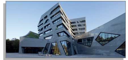
LEUPHANA UNIVERSITY OF LÜNEBURG » www.leuphana.de